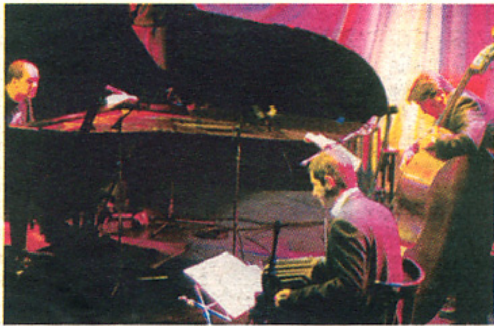
Tango Reflections Trio, del tango a Monk.

El festival dedica una noche a la magia del tangojazz